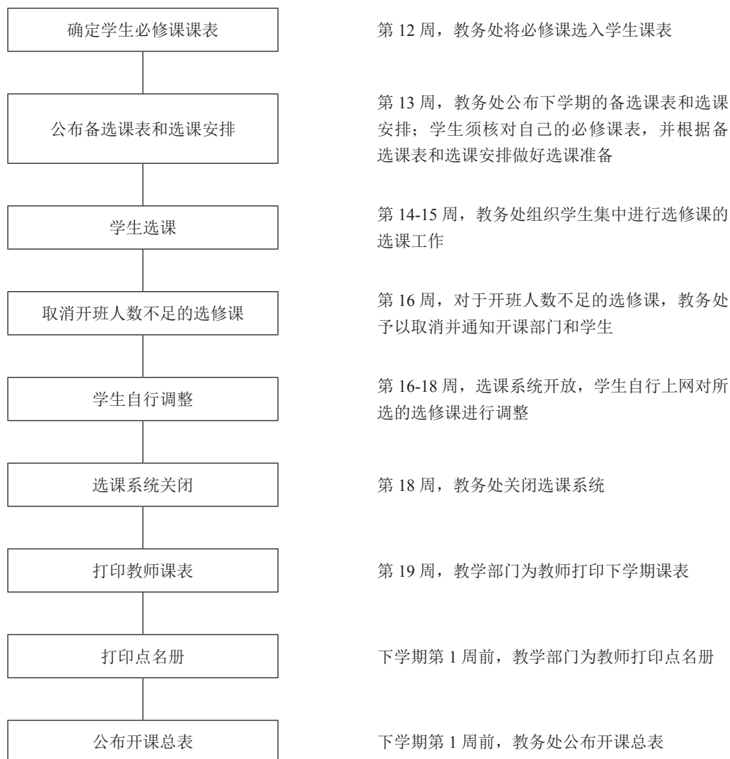
图 2 选课操作流程

新生第一学期选课安排在正式上课前一周内进行，其他年级学生的选课工作均于开课前一学期集中进行，主要选课操作流程如图 2 所示。