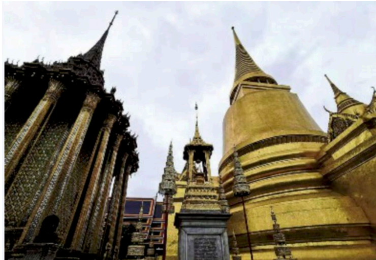
“一带一路”沿线国家泰国的曼谷大皇宫。

“一带一路”沿线国家和地区多为气候和生物多样性较为脆弱的国家，当前仍面临较大的气候风险和生态环境保护的压力。日前，生态环境部等部门联合发布《关于促进应对气候变化投融资的指导意见》，对气候投融资进行顶层设计。